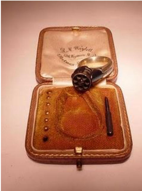
Un revolver anillo del año 1870.

La imagen de arriba nos muestra una "potente" (en comparación con su tamaño) arma de calibre 0,6, en un estuche de cuero con aspecto de cartera para evitar ser descubiertos. O mejor dicho descubierta, pues se trata de un anillo de mujer, con revolver incluido. Sorprendente no? Debajo, un modelo diseñado para hombres, el mecanismo es similar al anterior.