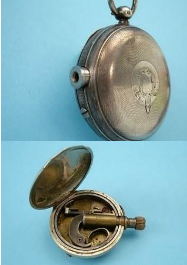
Relojes pistola fabricados por la firma inglesa "English Patent Railroad Pocket Watch, calibre 3 mm.