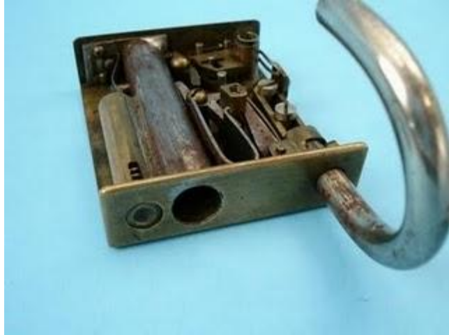
Pistola candado calibre .38 con dos llaves de seguridad