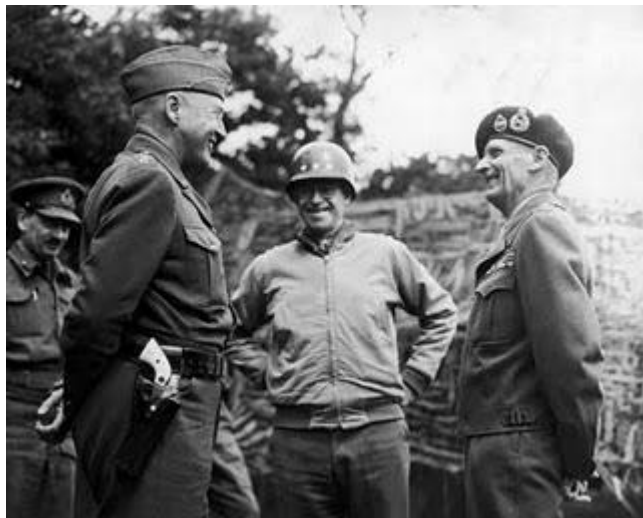
El General con su famoso Colt al cinto

.- Otra arma, en este caso un revolver ya de por sí famoso, el Colt 45, al que el general George S. Patton, encumbró de manera definitiva. De todos es conocida la veneración que el General sentía por las armas salidas de la Fábrica Colt. En diversas instantáneas se le puede ver portando la pistola Colt mod. 1911 A1; pero por la que de verdad sentía especial predilección era por éste de la foto, el Colt Army, calibre .45 de simple acción, enteramente troquelado y con cachas de marfil con sus iniciales.