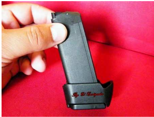
Ajuste y colocación en el arma.